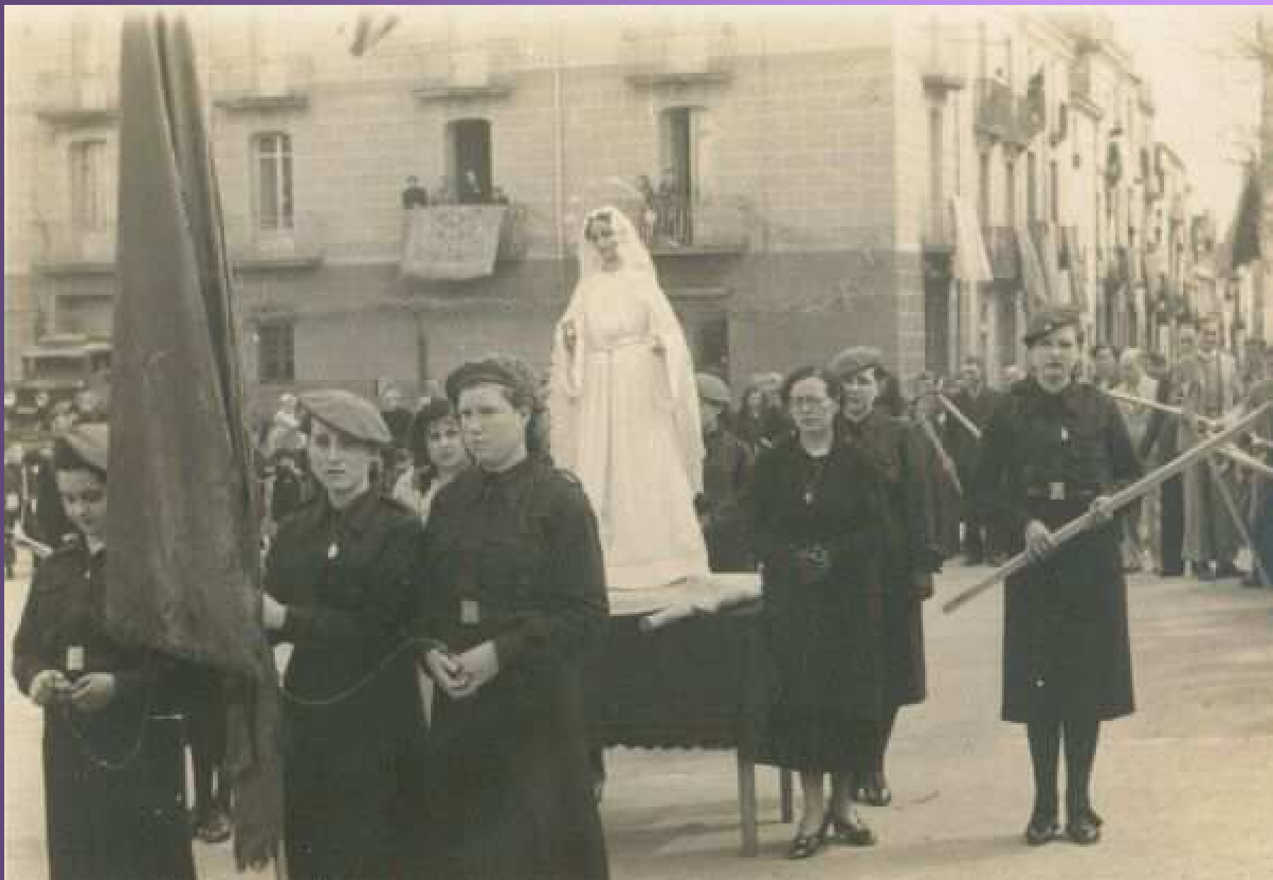
Sección Femenina de Falange Local portando la Madre de Dios del Socorro